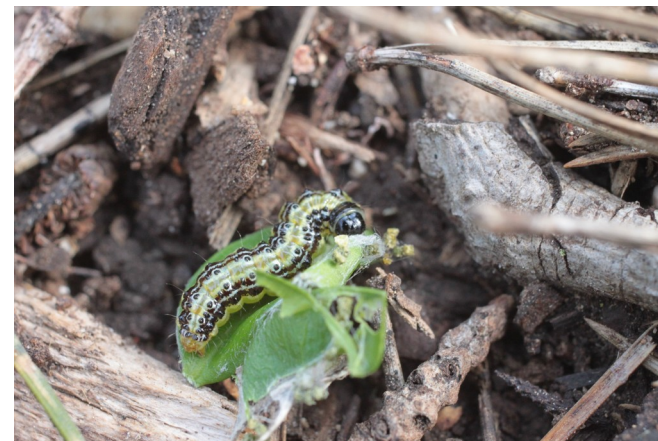
La chenille de pyrale du buis.

▪ La pyrale du buis a progressé en forêt dans de nombreux endroits : le long des vallées de la Saône et de l'Ain, sur les coteaux calcaires bourguignons et franc-comtois, sur le piémont pyrénéen, sur les marges du Massif Central, en Dordogne, en Charente-Maritime... Dans la vallée du Rhône, sur les zones totalement défeuillées en 2016 par la pyrale du buis, les arbres ont refait des gourmands. La consommation de ces gourmands est survenue en fin d'été. On a continué à voir progresser les défoliations : la limite altitudinale de 600 mètres identifiée en 2016 a été dépassée et des défoliations totales ont été notées jusqu'à 900 mètres. Ces défoliations ont causé de réelles inquiétudes : d'une part, liées à l'augmentation du risque incendie, d'autre part, en liaison avec les mortalités des parties aériennes du buis et sur la pérennité de l'essence sur de vastes zones où elle est la composante unique du sous-étage. La présence des imagos pose des problèmes dans les secteurs où les papillons envahissent les zones urbani-