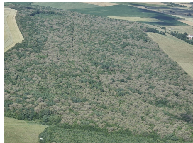
La processionnaire vue du ciel, près d'Étain dans la Meuse

où sa présence marquée a nécessité l'évacuation de deux lycées.