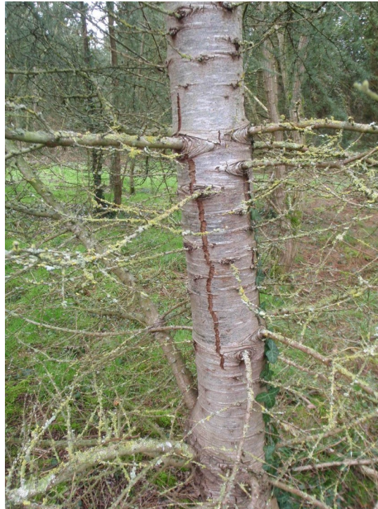
Fente de sécheresse sur cèdre

▪ Dans l'Aude, de fortes pertes foliaires et des jaunissements sont survenus en fin d'hiver, sans que l'on puisse mettre en évidence des facteurs biotiques. Ces symptômes avaient déjà fait l'objet de signalements similaires en 2008.