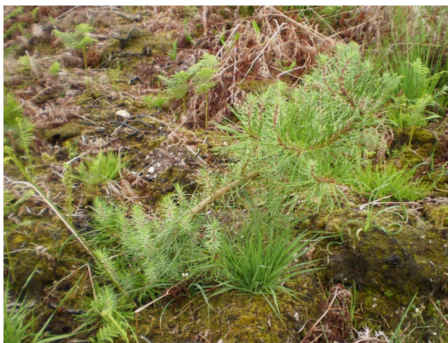
Verse du pin maritime

Tours et Angers, et de façon plus éparse en Nouvelle-Aquitaine (Lot-et-Garonne et Gironde). Les conditions climatiques (en particulier les précipitations abondantes du printemps 2016, la douceur du printemps 2017 et les coups de vent) a vraisemblablement favorisé ce processus en facilitant une croissance exubérante. Si certains peuplements peuvent se redresser, pour d'autres, la situation est irrémédiable.