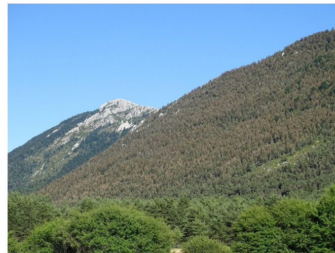
Un versant défolié par Epinotia subsequana

▪ Une mineuse du sapin peu commune, Epinotia subsequana , a attaqué une sapinière du Var sur 200 hectares, avec un risque important de dépérissement, le gui étant largement présent dans ce peuplement en limite de station.