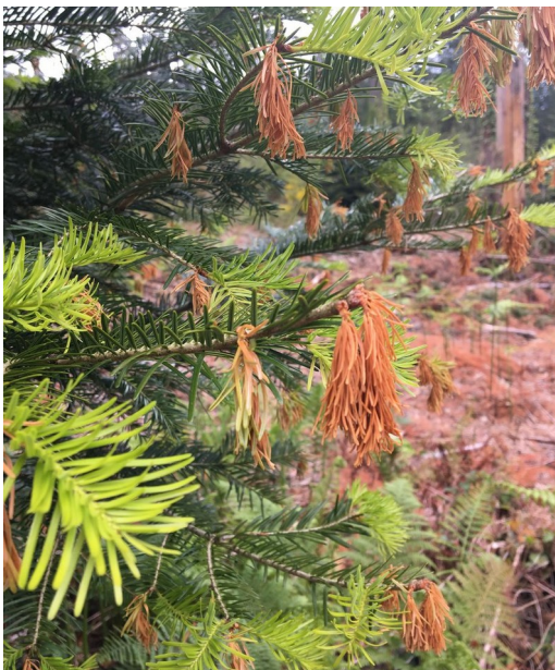
Jeunes pousses de sapin nécrosées par le gel, dans l'Hérault

▪ Les dégâts de gel tardif ont été particulièrement importants et répandus : les signalements de gel ont uniformément frappé la forêt française. Il faut en chercher la raison dans la période de froid inhabituel qui a eu lieu à la fin du mois d'avril, alors que la végétation avait déjà bien démarré grâce à la douceur qui prévalait depuis le début du mois de mars. Ce sont d'ailleurs les feuillus qui ont été les principales essences touchées : les chênes caducifoliés en premier lieu, mais également le hêtre et dans une moindre mesure, le châtaignier, le frêne, le robinier ou le noyer. Autre victime collatérale, les chenilles défoliatrices ont également été perturbées dans leur développement par cet épisode de froid inattendu.