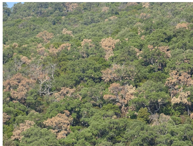
Jaunissement de houppiers de chênes-liège

▪ Par rapport à 2016, le cynips Callirhytis rufescens est en nette régression dans le massif des Maures.