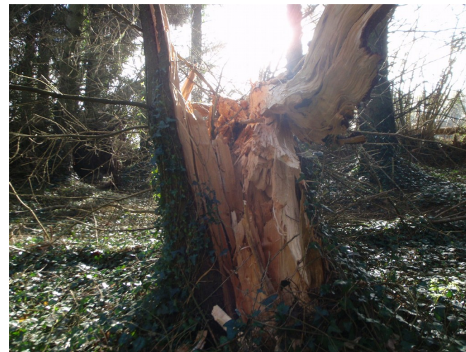
Dégâts de Zeus sur épicéa de Sitka, avec l'aide de la phéole de Schweinitz

12000 m 3 à terre ) et l'épicéa commun (Massif central, Jura). En outre, la tempête Egon du 12 au 13 janvier a parcouru le nord de la France et renversé plusieurs milliers de m 3 de hêtre dans les forêts de Seine-Maritime et a occasionné des dégâts disséminés dans les Ardennes et la Meuse.