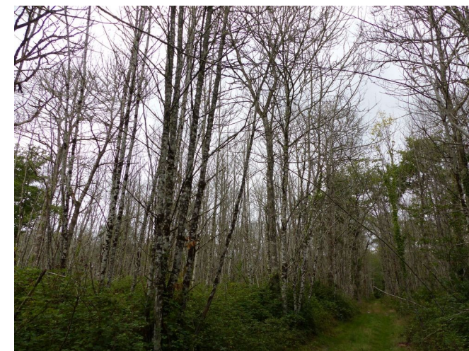
Dégâts d'encre sur châtaignier

Bergholtzell. À ce jour, les seules régions encore indemnes sont l'ouest de la Bretagne, la Normandie et l'est de la France (en-dehors du signalement ponctuel cité ci-dessus). Son parasitoïde, Torymus sinensis , régule fortement les populations quelques années après son arrivée, ainsi que des Torymus autochtones.