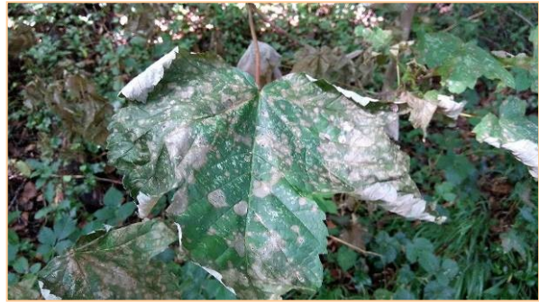
Maladie des tâches blanches de l'érable (76) – CRPFN -

Cette maladie est très peu fréquente mais peut se développer fortement lors de printemps pluvieux comme ce fût le cas cette année. Une pluviométrie normale au printemps 2017 permettra sans doute de voir cette maladie disparaître.