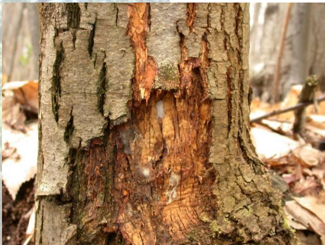
Chancre du châtaignier

La situation sanitaire de cette essence est toujours préoccupante ( dépérissement , encre , chancre ...). La valorisation du Châtaignier est localement remise en cause.