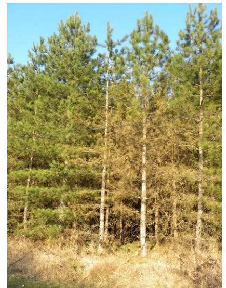
Peuplement de pin laricio fortement atteint par la maladie des bandes rouges

En Vienne et Deux-Sèvres, le champignon est désormais présent sur le pin maritime tout en restant relativement discret. L'importance de la maladie a justifié la mise en place d'un réseau de surveillance national. Il est constitué de placettes notées chaque année au printemps. Ces observations permettront d'assurer un suivi approfondi de la maladie et de ses impacts (croissance, lien avec la sylviculture...).