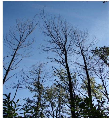
Mortalité de châtaignier due à la maladie de l'encre