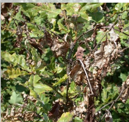
Jeunes pousses de chêne gelées

La gelée du 20 mai a provoqué, localement (Gâtine, Terres de Groie, Vienne), des destructions des jeunes pousses naissantes, entraînant des rougissements spectaculaires mais sans conséquence pour les arbres. Les chenilles de bombyx cul-brun et de processionnaire du chêne qui s'étaient développées dans le nord du Poitou-Charentes retrouvent un niveau de population endémique.