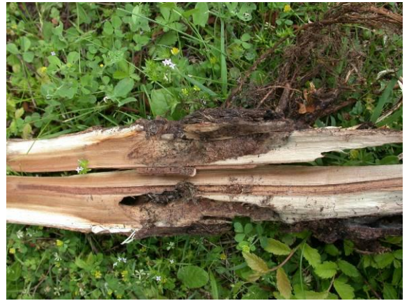
Galleries de grande sésie au pied d'un jeune plançon de peuplier

Le puceron lanigère est resté très discret dans les secteurs habituellement concernés.