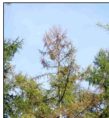
Dessèchements de cime sur mélèze du Japon adulte

Parallèlement à cela, une recherche de Phytophthora ramorum a été effectuée dans un peuplement de mélèzes du Japon, situé dans l'Aisne. Le DSF reste vigilant quant à la surveillance en milieu forestier de ce pathogène, absent de France en milieu naturel mais à l'origine de dépérissements massifs sur le mélèze du Japon, en Grande-Bretagne. Malgré des symptômes similaires (dessèchements de cimes, rougissement,...), l'analyse en laboratoire a permis d'écarter cette piste au profit d'une hypothèse d'origine climatique.