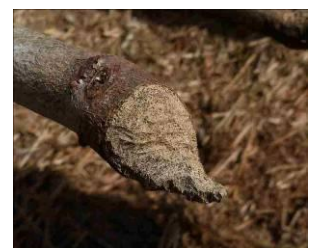
Dégâts de campagnol agreste sur plants de hêtre

Dans le département de l'Oise, des cas similaires ont été enregistrés, où les dégâts d'écorçage à la base de jeunes tiges ont surtout été préjudiciables aux charmes accompagnant des jeunes plantations. Ces observations mettent en évidence les différences d'appétence des essences forestières pour les rongeurs.