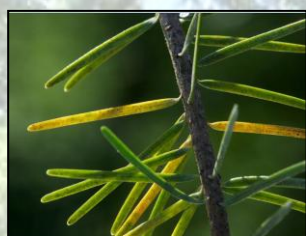
Rouille suisse sur aiguilles de douglas

Lors du suivi printanier de jeunes plantations de douglas, des jaunissements et rougissements ont été observés sur les aiguilles de l'année précédente (n-1). Ces symptômes s'accompagnaient de fructifications noirâtres sur la face interne des aiguilles, à l'origine de leur chute. La rouille suisse du douglas , champignon des aiguilles, a pu être identifiée.