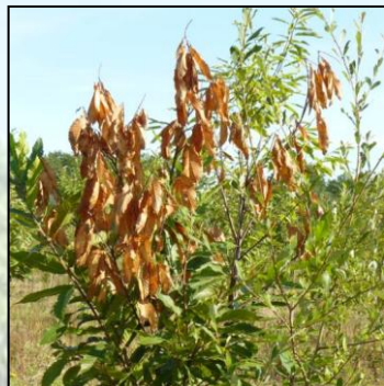
Châtaignier atteint de phytophthora

Suite à l'étude menée par l'INRA démontrant la présence de phytophthora en pépinières, une enquête du DSF a été réalisée dans des plantations de châtaignier du quart nord-ouest de la France, pendant l'été 2015. L'objectif était de détecter la présence éventuelle de Phytophthora , micro-organisme pathogène racinaire, provoquant des nécroses et pouvant mener à la mort de l'arbre. Les deux espèces les plus courantes, P. cambivora et P. cinnamomi , sont à l'origine de mortalités dans de nombreuses châtaigneraies plus méridionales, mais n'ont pour le moment jamais été signalées dans les plantations en Nord Pas-de-Calais - Picardie.