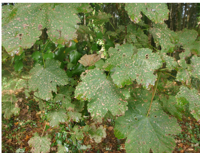
Maladie des taches blanches de l'érable.

mais des signalements ont également été fait cette année dans les Maures. Les conséquences sont dans la plupart des cas extrêmement néfastes pour les peuplements de châtaignier : la conjonction de l'encre et de la sécheresse a fortement marqué l'essence avec des mortalités parfois de plusieurs hectares d'un seul tenant mais aussi des taches de plus petite taille et des individus isolés. Même s'il s'agit toujours de peuplements loin de l'optimum stationnel, la situation s'est dégradée rapidement. Il est probable qu'au débourrement 2017, de nouvelles mortalités importantes soient visibles dans ces mêmes peuplements. En Dordogne, où la situation de l'essence reste très critique, des programmes de substitution d'essences sont engagés dans le cadre des mesures compensatoires liées à des défrichements.