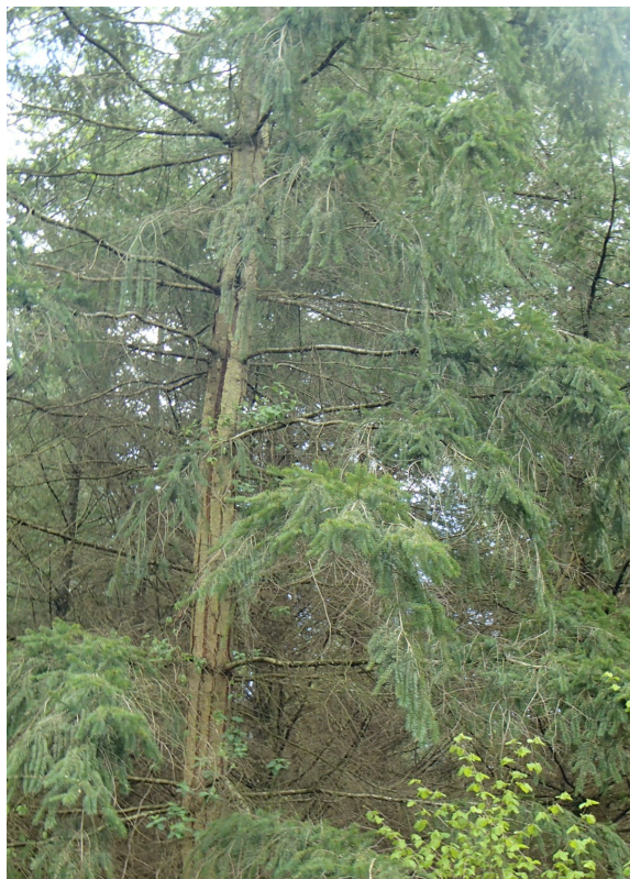
Nécrose cambiale sur le tronc d'un douglas

de façon plus discrète dans le Grand Est, où sa présence pourrait avoir été jusqu'à maintenant sous-estimée.