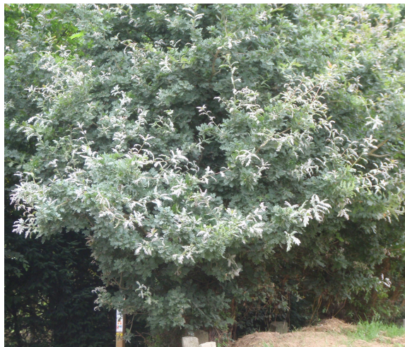
Pas de doute, c'est de l'oïdium.

▪ L' oïdium retrouve un niveau d'attaque relativement élevé, proche dans son ampleur à celui qui avait été constaté en 2013, année dont le printemps avait également été pluvieux. Mais alors qu'en 2013 les dégâts avaient été signalés dans l'est de la France, cette année, ils se sont plutôt concentrés dans le centre Ouest, dans une zone allant de la Bretagne jusqu'à l'Allier, ainsi que dans la partie occidentale du piémont pyrénéen et quelques signalements le long de la frontière belge. La zone la plus durement touchée s'étend de Blois à Moulins, où les premiers signalements ont eu lieu dès la fin du mois de juin, en particulier dans les peuplements qui avaient déjà été défoliés par les chenilles phyllophages.