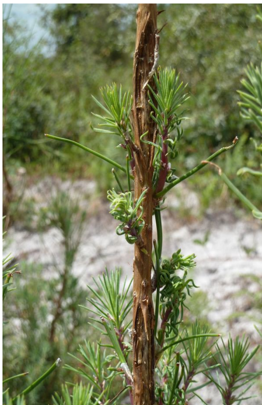
Dégât de grêle dans les Landes

leur suite, des rougissements généralisés liés au développement de Sphaeropsis sapinea sont apparus rapidement, qui compromettent sérieusement l'avenir de ces peuplements. D'autres essences comme le douglas, le mélèze ou divers feuillus ont subi les mêmes dommages mais ont réussi à refaire une partie de leur masse foliaire en cours d'été.