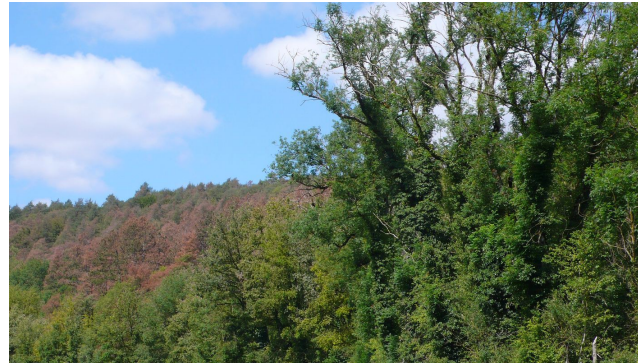
Rougisement dû à Diplodia sapinea dans l'Yonne, après la grêle du 27 mai

▪ Les dégâts de Diplodia (= Sphaeropsis) sapinea ont essentiellement concerné l'Auvergne, la vallée de la Loire, la Bourgogne et les Vosges du Nord. C'est en Bourgogne et en Auvergne que les dégâts ont été liés de la façon la plus manifeste aux averses de grêle.