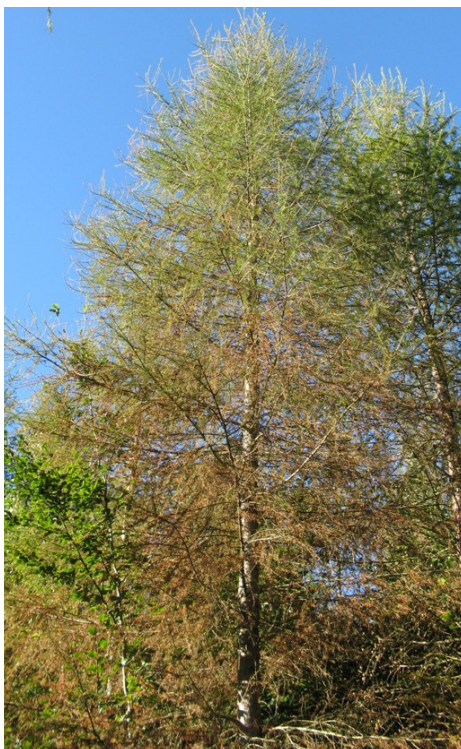
Bas du houppier d'un mélèze touché par Mycosphaerella laricina