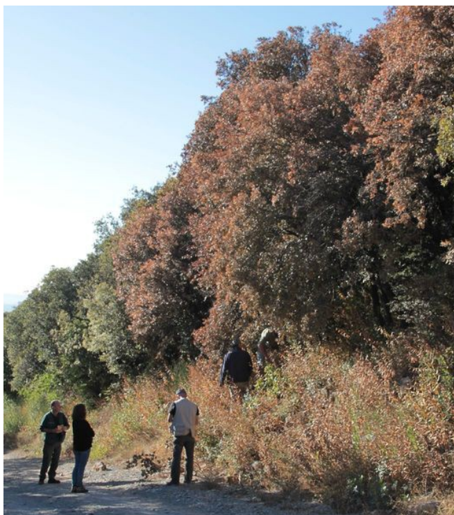
Chênes verts ayant subi la sécheresse dans l'Hérault

▪ Comme en 2015, la canicule et surtout la sécheresse persistante ont été responsables de nombreux signalements de colorations et de pertes de feuillage, mais avec une géographie différente par rapport à l'année précédente. L'est de la France a en effet été moins touché en 2016 par ce phénomène, alors que de nombreux signalements ont été réalisés cette année en Provence, dans les Pyrénées orientales, en Bretagne et en Normandie. Les essences les plus touchées sont les chênes verts et pubescents, et les pins, en particulier, les jeunes plantations de pins maritimes dans les Landes. En dehors de la zone