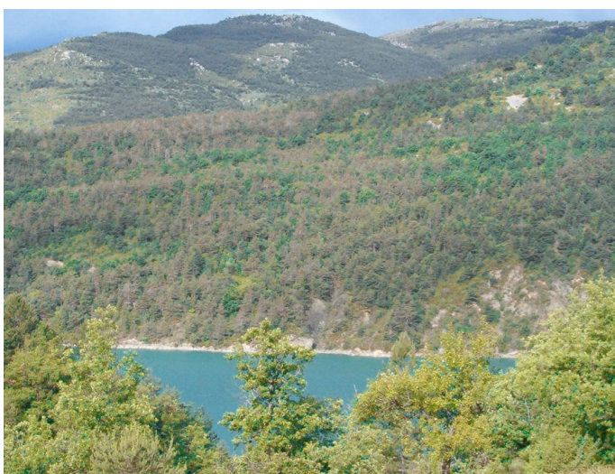
Versant sinistré à proximité de Saint Julien du Verdon, dans les Alpes de Haute-Provence, lors de l'été 2004

Les contextes stationnels dans lesquels le dépérissement a causé le plus de dommages disposent d'une ressource hydrique moyenne à médiocre, sauf dans le cas des Alpes Maritimes où les dégâts concernent principalement des secteurs à très forte pente et à sol superficiel.