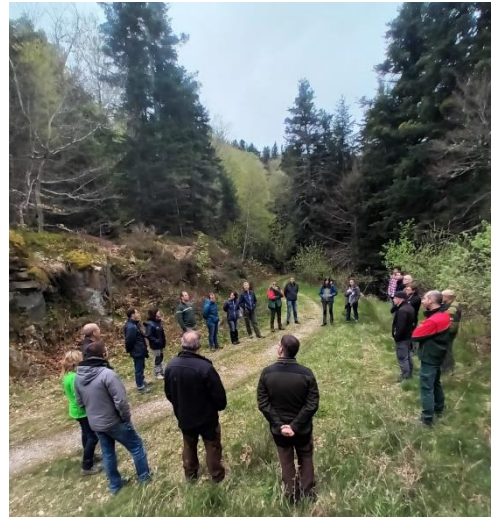
Sapinière d'Ax les Thermes

Dans les reboisements de pins noirs et de pins maritimes pyrénéens, un autre organisme introduit, Lecanosticta acicola ou maladie des taches brunes, côtoie la maladie des bandes rouges ( Dothistroma septospora et D. pini ), émergente en France depuis les années 2000. En forêt de Puigcerda, le groupe a évoqué la récente pression exercée par ces pathogènes qui peuvent fortement impacter la croissance et la gestion des peuplements.