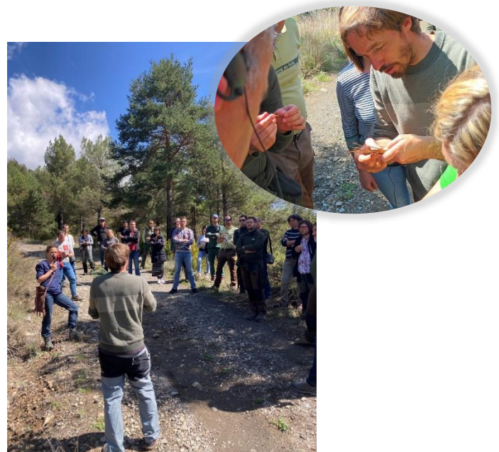
Maladie des bandes rouges à Puigcerda

La traversée de la chalarose (champignon d'origine asiatique) de l'autre côté des Pyrénées n'a pas encore été observée mais le sujet, récemment observé dans les Pyrénées françaises méritait une présentation des symptômes et de son impact sur le frêne (forêt d'Alston (09)).