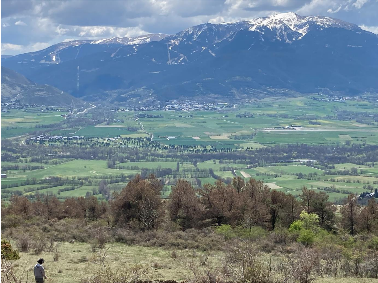
Peuplement défolié par la chenille processionnaire du pin à Puigcerda

Sur un peuplement défolié à 100 % par la chenille processionnaire du pin , les traitements ont été appliqués en Catalogne. C'est la seule province qui continue les traitements aériens dans un contexte où les espèces qui régulent ce ravageur semblent très impactées par le changement climatique.