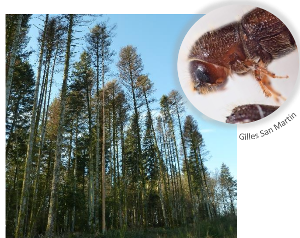
Gilles San Martin

Originaire d'Asie, la pyrale est redoutable pour le buis dont elle consomme le feuillage et parfois même l'écorce. Les scolytes du sapin peuvent conduire à d'importantes mortalités dans les sapinières affaiblies.