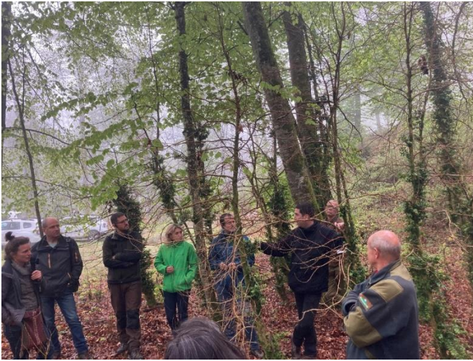
Pyrale du buis à Soula (09)