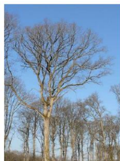
Chêne sain en catégorie B