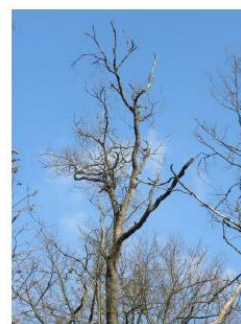
Chêne très dégradé en catégorie E

La journée a permis de rappeler l'intérêt de l'outil DEPERIS qui offre le moyen simple de quantifier l'état de santé d'un massif et de le suivre dans le temps.