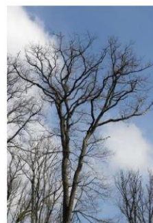
Chêne dégradé en catégorie D