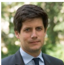
Julien Denormandie Ministre de l'Agriculture et de l'Alimentation

Notre pays traverse depuis plusieurs mois une crise sanitaire sans précédent. Cette crise a rappelé le caractère stratégique de la production agro-alimentaire nationale pour assurer la sécurité alimentaire du pays et contribuer à nourrir le monde.