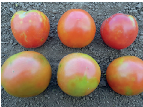
Anses /Pascal Gentit