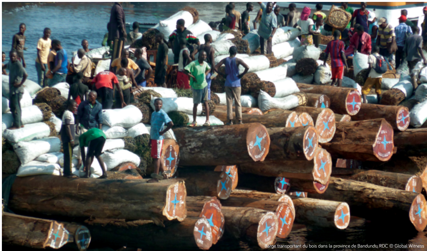
Barge transportant du bois dans la province de Bandundu, RDC