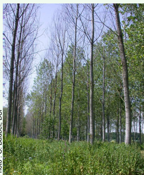
Mortalités en peupleraie