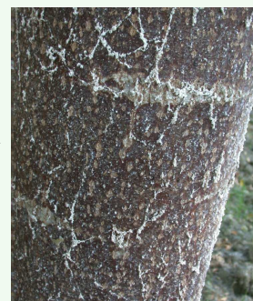
Vue détaillée d'une colonie