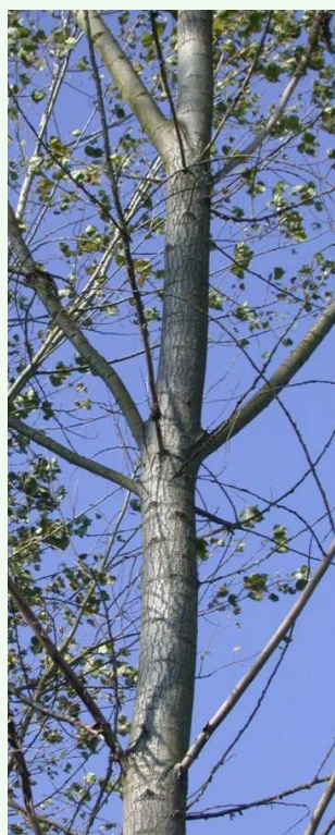
« Peau de lézard »

Les dégâts sont liés aux sécrétions injectées par l'insecte au moment de la prise de nourriture à travers l'écorce. Les conséquences de ces attaques sont importantes lorsque plus de 30 % de la hauteur du tronc (par rapport à la hauteur totale de l'arbre) est recouverte par des colonies.