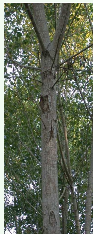
Nécrose du tronc

D'une manière générale, les arbres de lisières sont épargnés et les dommages les plus importants se trouvent à l'intérieur des peuplements.