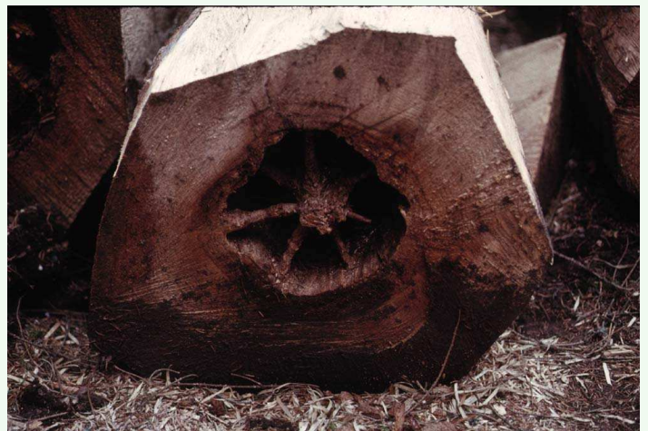
Pourriture de cœur sur épicéa commun