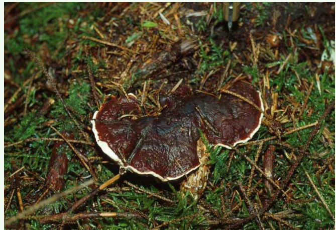
Sporophore de fomes, face supérieure