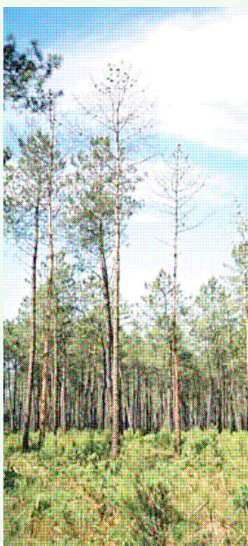
Dépérissement sur pin maritime

La lutte contre le fomes est essentiellement préventive, et se fait par badigeonnage ou pulvérisation d'un produit antagoniste à la surface des souches des arbres fraîchement exploités, afin d'empêcher leur infection.