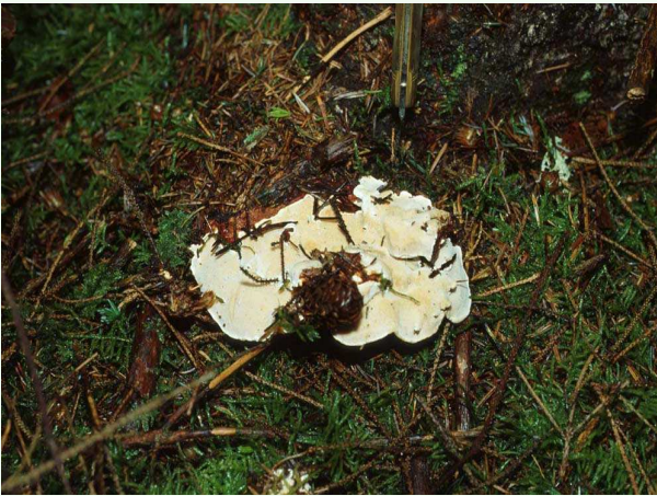
Sporophore de fomes, face inférieure

honen ; initialement décrite sur sapin, elle est rencontrée en France, sur divers résineux notamment les sapins et le douglas,