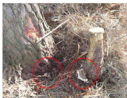
Pin mort par contact racinaire avec souche d'éclaircie contaminée par le fomes

En zone à risque, ce traitement, mécanisable à l'aide d'un dispositif adapté sur les abatteuses, devrait être mis en œuvre dans les peuplements lors des éclaircies et les coupes rases suivies de reboisements résineux. Sur anciennes terres agricoles, l'absence d'antagoniste naturel accélère le développement de la maladie.