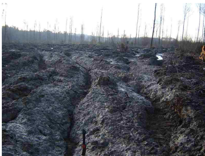
Orniérage après passage d'engins forestiers lourds (le tassement affecte un volume supérieur à la trace)

La circulation sur des cloisonnements constitue généralement une réponse suffisante au risque de tassement sauf en cas de pluies persistantes comme en 2013, où la faisabilité des coupes n'est pas toujours estimée avec suffisamment de soin.