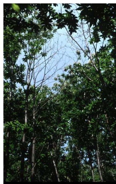
Dépérissement de cèpées de châtaignier dû à la maladie de l'encre

Le débourrement affiche un retard d'environ 3 semaines, ce qui n'empêche pas les gelées très tardives d'affecter les pousses de jeunes plants. Dans les stations à faible écoulement de l'eau, l' ennoisement des plantations provoque quelques mortalités par asphyxie du système racinaire, en particulier chez le douglas. L'excès d'eau favorise le développement de la maladie de l'encre du châtaignier. Le coup de vent de fin juillet en Mayenne arrive sur des sols saturés en eau et provoque quelques chablis. Humidité et douceur automnale déclenchent une explosion tardive d' oïdium dans les jeunes boisements de chênes. Des gelées précoces touchent localement les tissus imparfaitement lignifiés. Dirk occasionne de faibles dégâts disséminés sur la région.