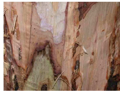
Nécrose en flamme caractéristique de l'encre

A cause de leur système racinaire dégradé, les arbres atteints présenteront une sensibilité accrue à tout stress hydrique.