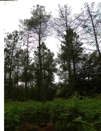
Mortalité de pin maritime due au fomes