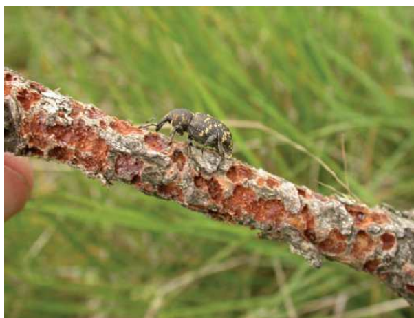
Le traitement des plants contre l'hylobe est un usage « forêt » dans la notice « ZNA »

2 – l'usage « arbres et arbustes » dans la notice « cultures ornementales » : sont concernés les pépinières ornementales et forestières, les peupleraies, les oseraies, les plantations de sapins de Noël, les vergers à graines, les suberaies cultivées, les truffières artificielles, les boisements de terre agricole, les taillis à courte et très courte rotation (TCR et TTCR).