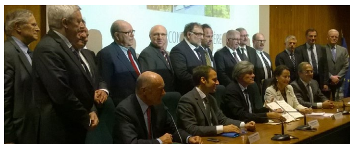
Signature du Contrat de filière en présence de 3 des 4 ministres impliqués et des représentants des acteurs engagés, le 16 décembre 2014.